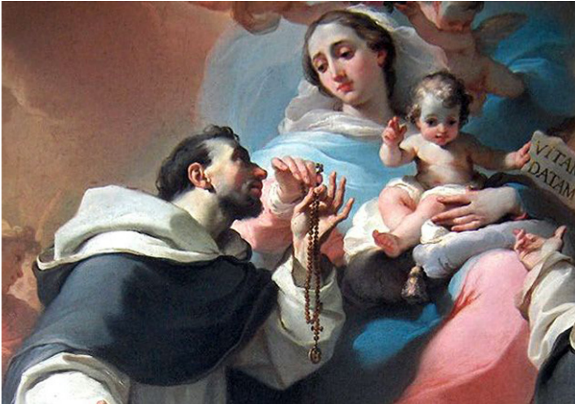
Santo Domingo recibe de la Virgen el Santo Rosario

el Purgatorio. El extraordinario poder del Rosario ha mediado en muchos milagros. Algunos, incluso, están documentados. Christine Galeone, del portal Beliefnet , te presenta estos seis milagros asombrosos asociados con el Rosario.