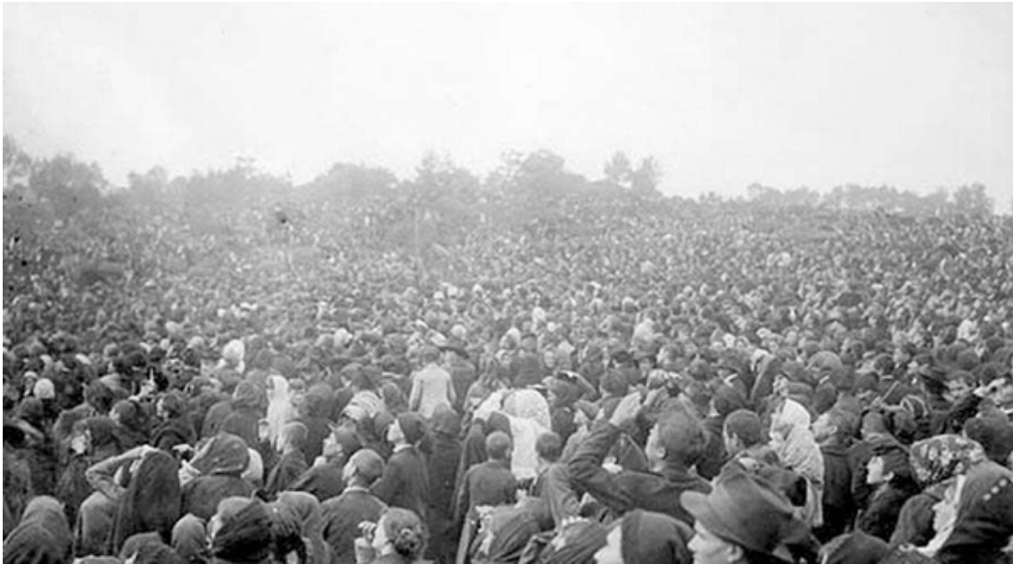
Milagro del sol en Fátima, Portugal

herejía albigense y lo convirtió en el fundador... de una gran orden religiosa”.