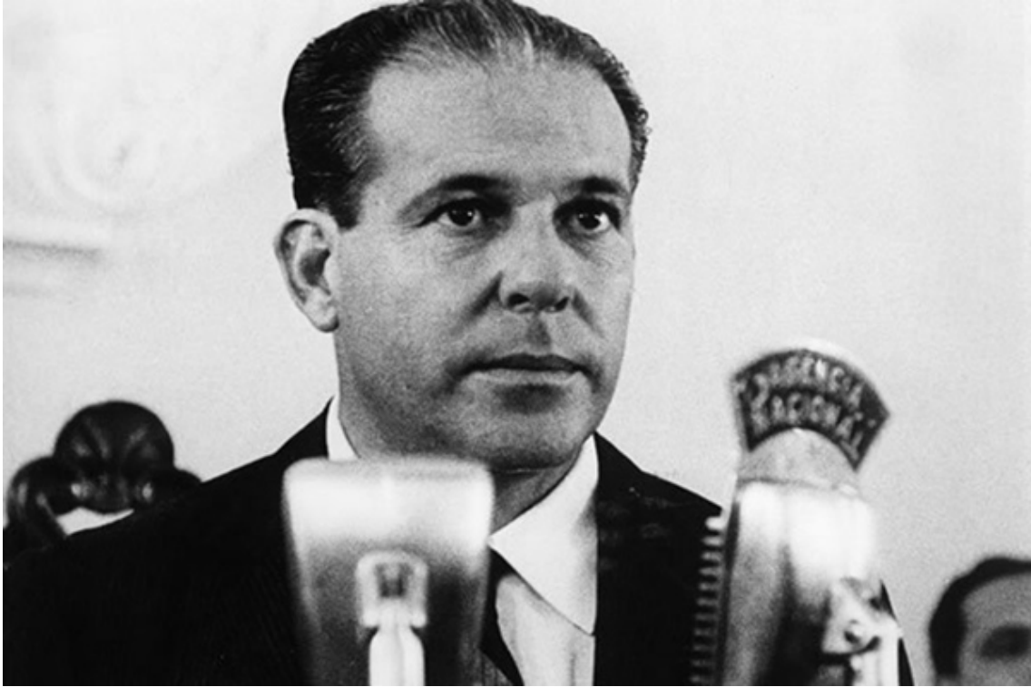
El presidente de Brasil, Joao Goulart