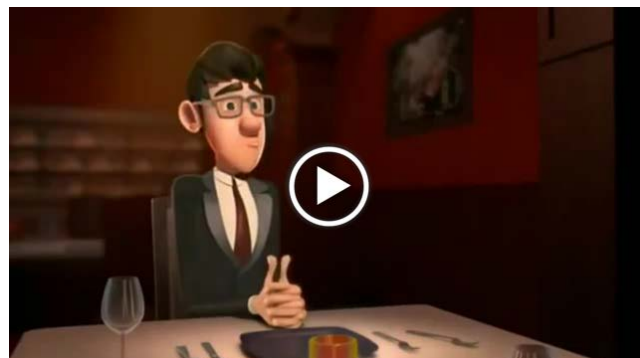
Corto de animación "Cerebro dividido".

Si se tiene vida de oración, capacidad de reflexionar y de ver las cosas desde una perspectiva distinta, el diálogo es ciertamente enriquecedor y la relación no se deja llevar por las pasiones volubles de cada momento.