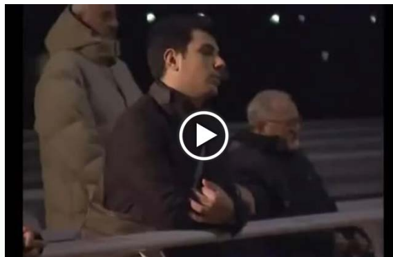
Regina Caeli (Reina del Cielo)

Comenta esta recomendación de “Para hacer en familia”: El Regina Caeli es una oración con la que felicitamos a santa María por la resurrección de su Hijo. Se reza durante el tiempo de la Pascua, a las 12 de la mañana.