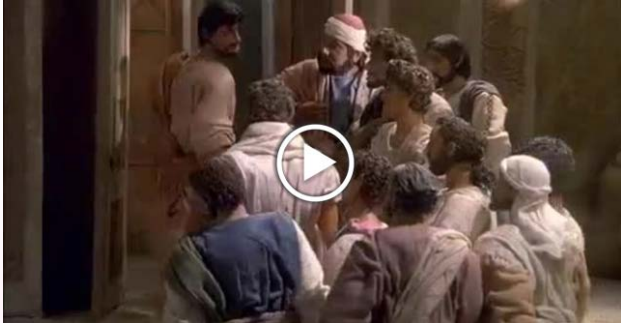
Película El hombre que hacía milagros, escena de la confesión de Tomás.

Comenta esta recomendación de “Para hacer en familia”: La primavera es como una metáfora de la Resurrección. La naturaleza, las plantas, que parecían morir en el invierno, resucitan - florecen en primavera: el tiempo de la Resurrección de Jesús. Quizás esta metáfora te ayude a entender mejor y a explicar a los niños cómo de la muerte surge la vida.